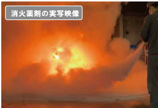
消火薬剤の実写映像